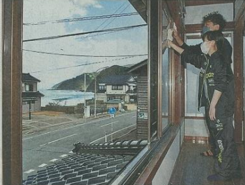
海見える会員制宿泊施設の開設へ準備を行う With優のスタッフら =鶴岡市由良2丁目

NPO法人With優(株)は、白河市に本社がある。白河市は水産資源が豊富で、漁業関係者の交流が盛ん。同市の民家を改装し、会員制の宿泊施設として来春に新たな開設の計画を進めている。(木村友理)