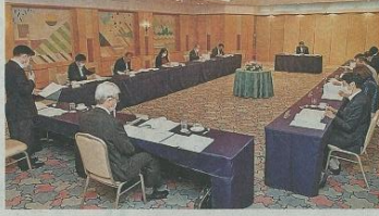
2023年度の援助・助成先 協議し実施委員会 10月6日、山形市山形ラフォー

山形放送愛の事業団、山形新聞、山形放送は2023年度の福祉応援・助成先として、不登校の子どもの支援や民話継承に取り組む団体、中高生らのボランティアサークルなどを決めた。それぞれの活動に思いをこめてサポートする。19年度同様、県民の善意を地域福祉の向上につなげる。行政の目的と向き合う部分を開発して、毎年継続している。6日に山形市の山形ラフォーホテルで運営委員会を開き、申請があった13社について支援にあたり、23年度助成・助成先のうち、23年度の活動を紹介する。(木村友理)